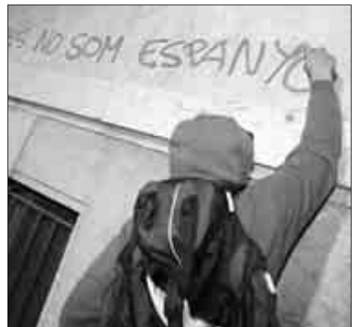
PINTADES. Alguns van deixar les reivindicacions marcades a les parets.