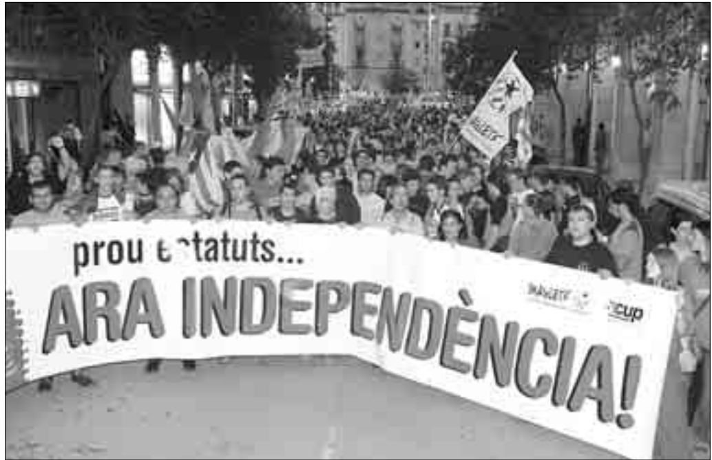
1.500 PERSONES. La manifestació d'ahir a Girona va congrega un públic multitudinari que va cridar les consignes independentistes pels carrers de la ciutat.

L'Estatut va ser un tema recorrent durant tota la jornada d'ahir i també gairebé el central de la manifestació de Girona. Així, alguns dels participants portaven «el bus de l'Estatut», fet de cartró i amb la cara dels representants polítics a les finestres. Per mostrar la disconformitat amb el text, els manifestants van cremar aquest objecte simbòlic poc abans d'arribar a l'edifici de Governació on, a més, van realitzar nombroses pintades que puntualitzaven que «Els catalans no som espanyols». A part de les pintades, algun pebret i alguna bengala una mica perilloses enmig de tanta gent, la manifestació va transcórrer amb tranquil·litat aixecant l'expectació de tothom amb qui es creuava.