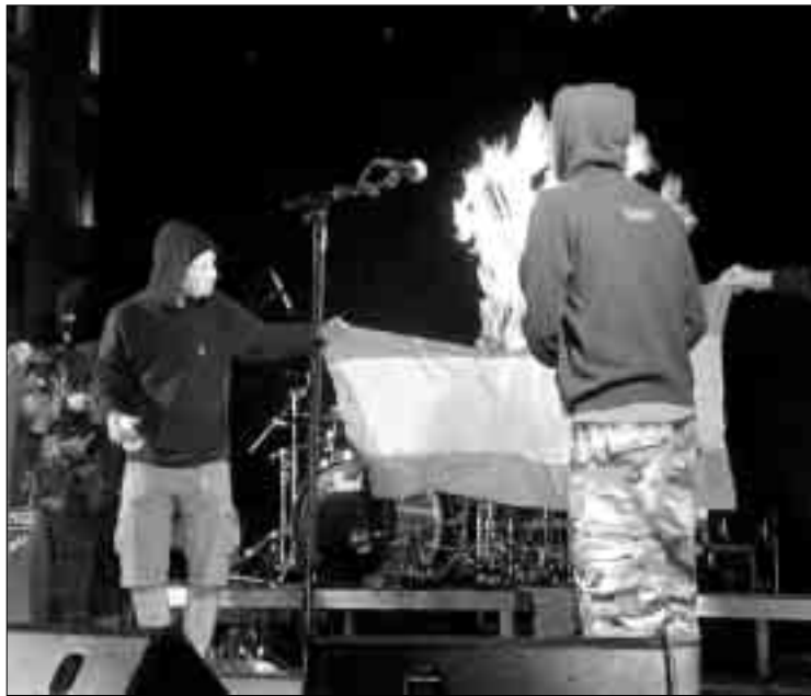
CREMA DE LA BANDERA ESPANYOLA. Dos encaputxats calant-li foc.

tida i van desplegar una pancarta on es podia llegir, de nou, «Fora Borbons. Contra la visita del Rei». Acompanyant i animant els escaladors hi va haver molts crits d'euforia i algun petard.