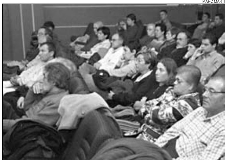
Debat Costa Brava. Grups col·lectius denuncien les agressions a la zona.

El debat de les organitzacions ecologistes a Llagostera va començar amb la projecció d'un documental d'Antoni Martí que comparava la Costa Brava dels anys 50 –anterior al gran impuls d'infraestructures dels anys 60– amb l'actualitat. El documental, Els límits de la Costa Brava , constava d'un recopilació filmada basada en els fons cinematogràfics del segle XX, a més de diversos mun-