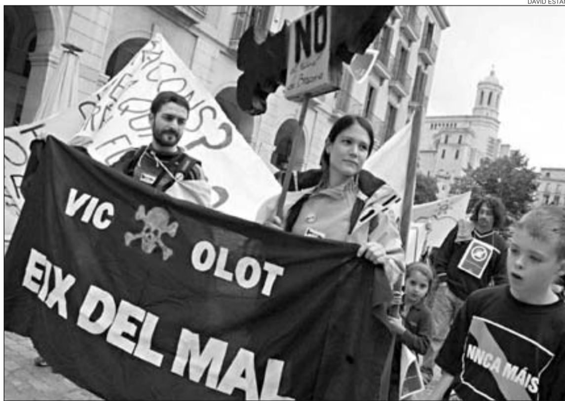
Pluralitat. Persones de diferents col·lectius ecologistes van poder mostrar les seves preocupacions.

Una trentena d'associacions reclamen un model sostenible i una democràcia participativa