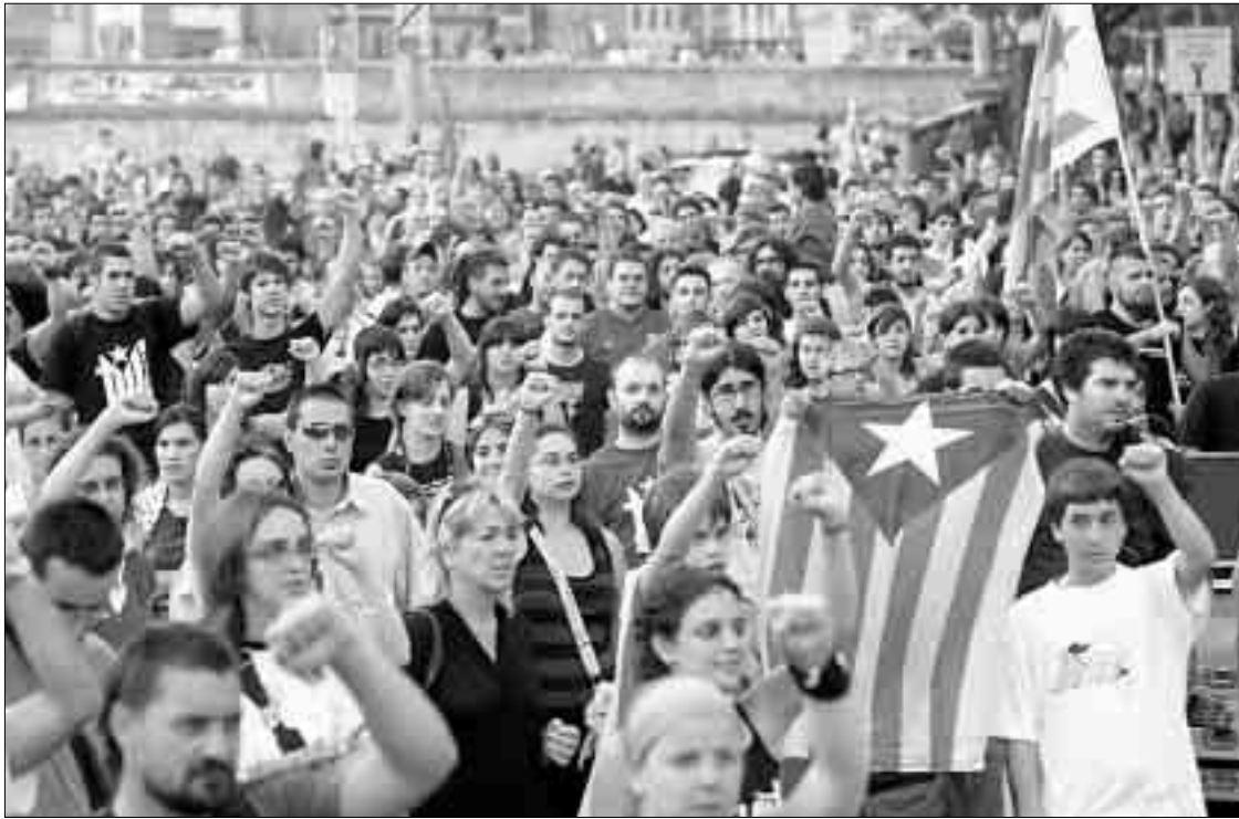
MANIFESTACIÓ. Unes 1.500 persones van assistir a la protesta convocada per la CUP i els Maulets de Girona.

Aquests futurs actes de protesta van ser recordats després també durant la manifestació que va començar poc després dels discursos. Amb crits com «Som una nació, autodeterminació», amb «Espanya anem en rere», «La llei d'estrangeria a la Reina Sofia» o «Fora Borbons», va arrencar la marxa fins a la cantonada del carrer Sant Francesc amb Jaume I. Allà, quatre encaputxats van pujar a una bas-