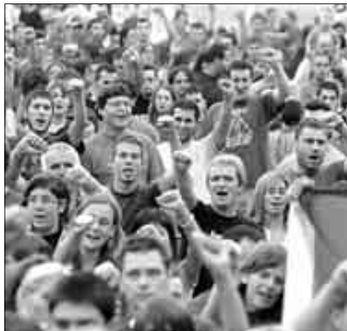
HIMNES. Durant la marxa es van cantar cançons catalanes i comunistes.