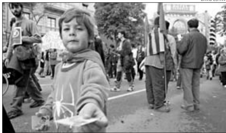
Distribució. Un nen ofereix una enganxina amb el lema «Salvem l'Empordà».