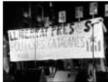
Pancarta i fotos de presos.

molts altres crits «contra l'opressió». A l'edifici de Jaume I els esperaven dos furgons dels Mossos d'Esquadra i diversos agents antiavalots que pretenien evitar atacs contra la Subdelegació. La seva presència i la