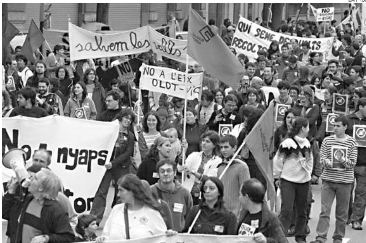
Concentració. Uns 1.500 manifestants de més de trenta associacions diferents van reivindicar ahir una política per la sostenibilitat.