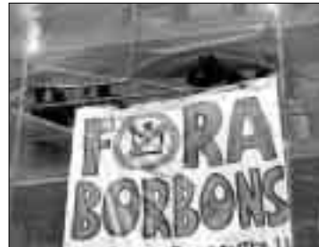
Pancarta contra el Rei en una bastida.

Un any més, la marxa es va dividir en dos blocs: el dels convocats per ERC, que aquest any va aconseguir reunir menys simpatitzants que en altres ocasions, i el format per simpatitzants d'altres partits i col·lectius d'esquerra i independentistes, com EUiA, Maulets, Endavant o el PSAN (Partit Socialista d'Alliberament Nacional).