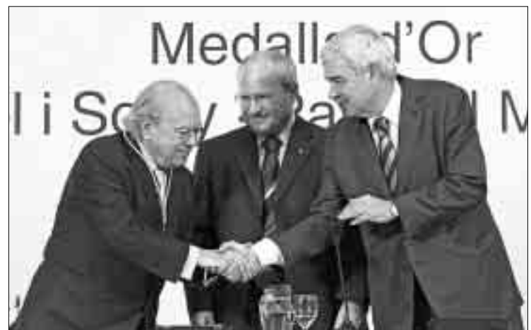
PRESIDENTS. Pujol, Montilla i Maragall durant l'acte d'ahir al vespre.

Pasqual Maragall va augurar que Espanya i la Unió Europea reconeixeran en el futur que Catalunya és una «nació», ja que els catalans tenen la «paciència» necessària per veure l'«eclosió» de les nacions sense Estat.