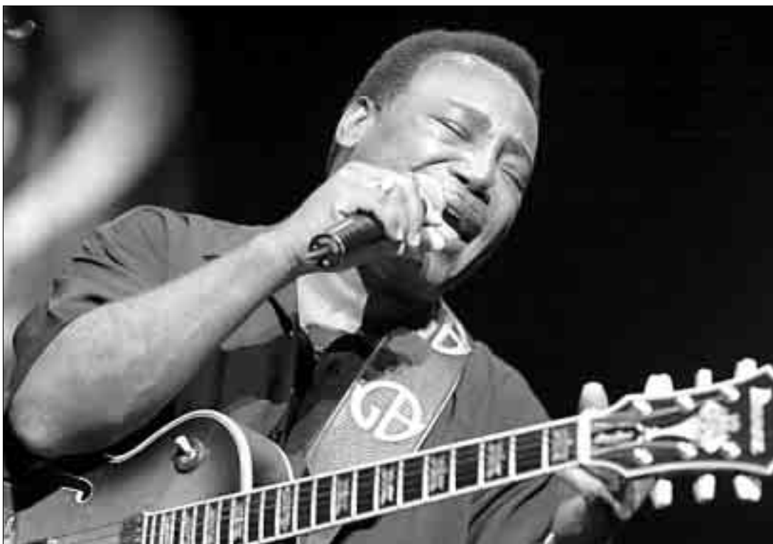
GEORGE BENSON. El famós guitarrista, ahir durant el seu concert als Jardins de Cap Roig.

D'altra banda, la cantant i pianista canadenca Diana Krall, l'estrella vocal del jazz contemporani, actuarà avui al Festival de la Caixa de Girona. En un concert per al qual s'han esgotat les entrades, Krall interpretarà els temes del seu vuitè disc, The girl in the other room , alguns compostos en col·laboració amb Elvis Costello, el seu company.